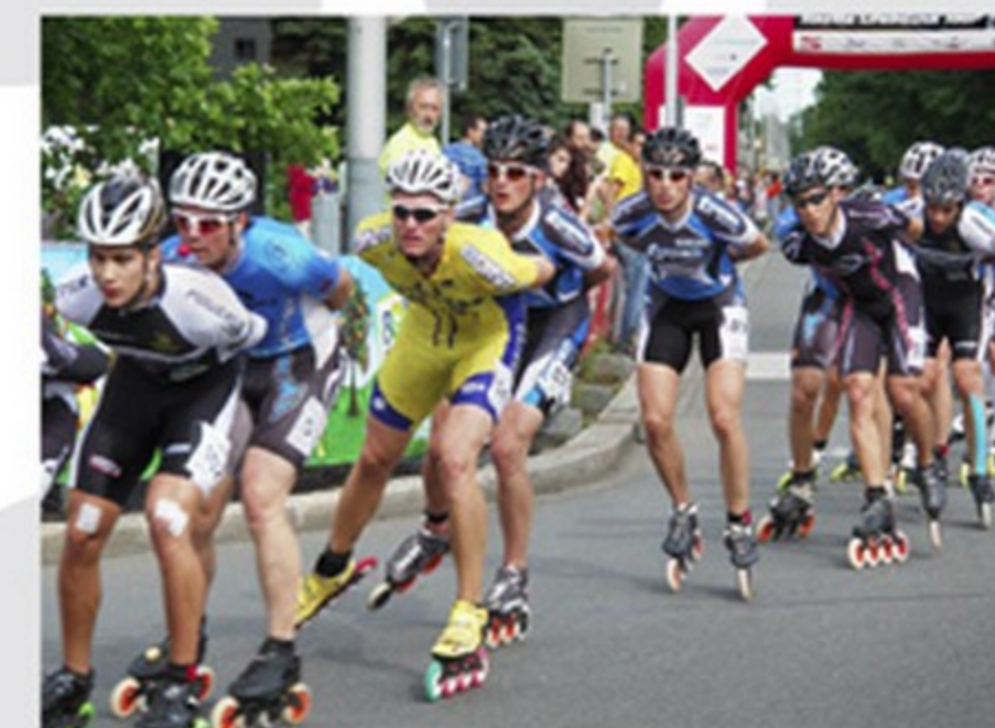
Světový pohár v in-line bruslení v Porubě

kromě zavedených sportovních akcí, mezi něž patří např. Zlatá tretra, se Ostrava zviditelňuje stále novými událostmi, jako Světovým pohárem v in-line bruslení, Davis Cupem apod.