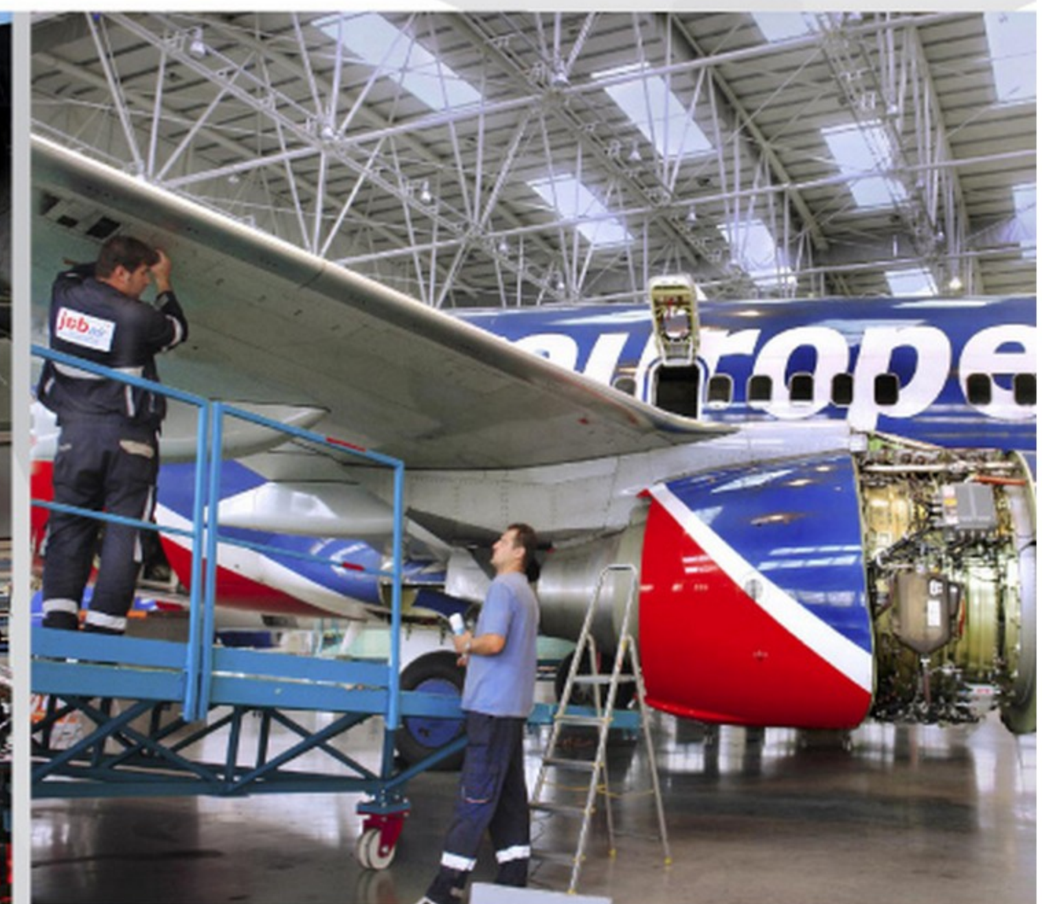
největší letecká opravna ve střední Evropě společností JOB AIR-CEAM a.s.