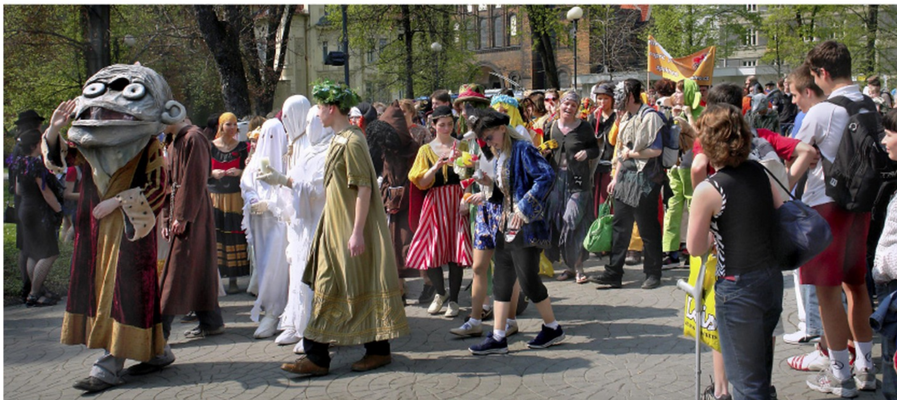
studentský majáles, Husův sad

do slovníku porevoluční studentské generace se opět dostalo po několik generací zapomenuté slovo majáles, a s ním se vrátila odvěká oslava bezstarostnosti mládeže