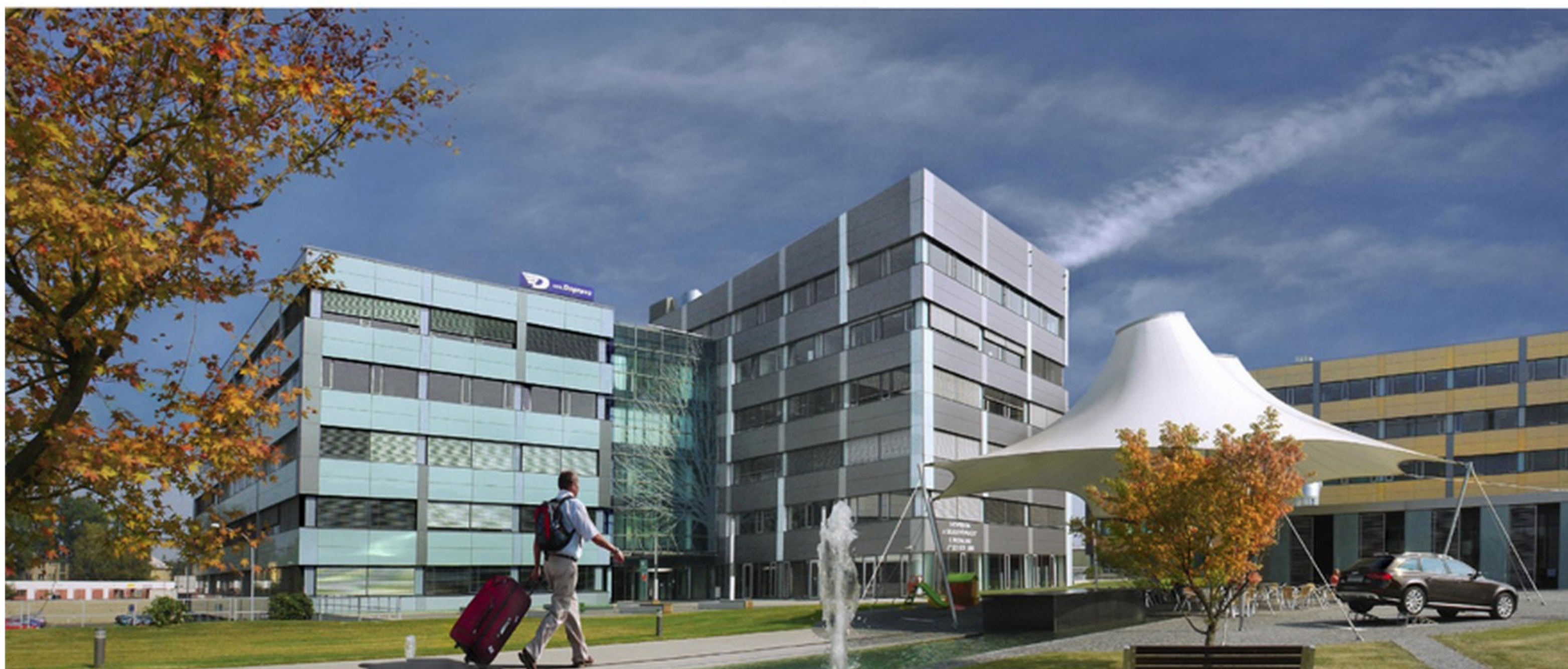
moderní komplex Orchard pro komerční využití