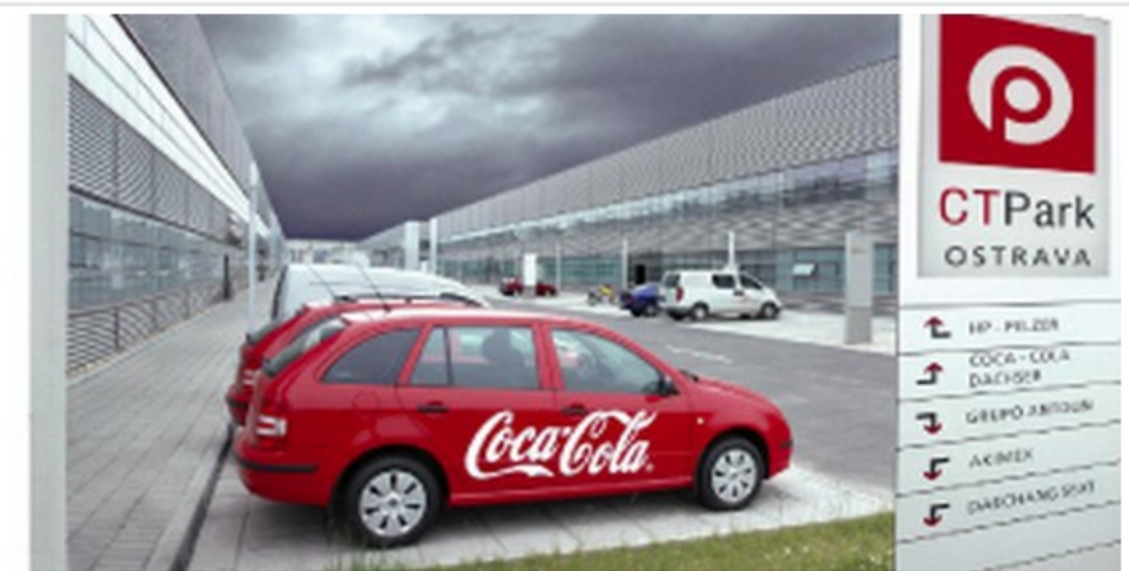
neustále se rozšiřující průmyslová zóna v Ostravě-Hrabové

změny po r. 1989 přinesly postupně snižování těžby uhlí i útlum hutního průmyslu, současná tvář města je spojována s novými průmyslovými obory, ale také dynamickým rozvojem služeb a obchodu