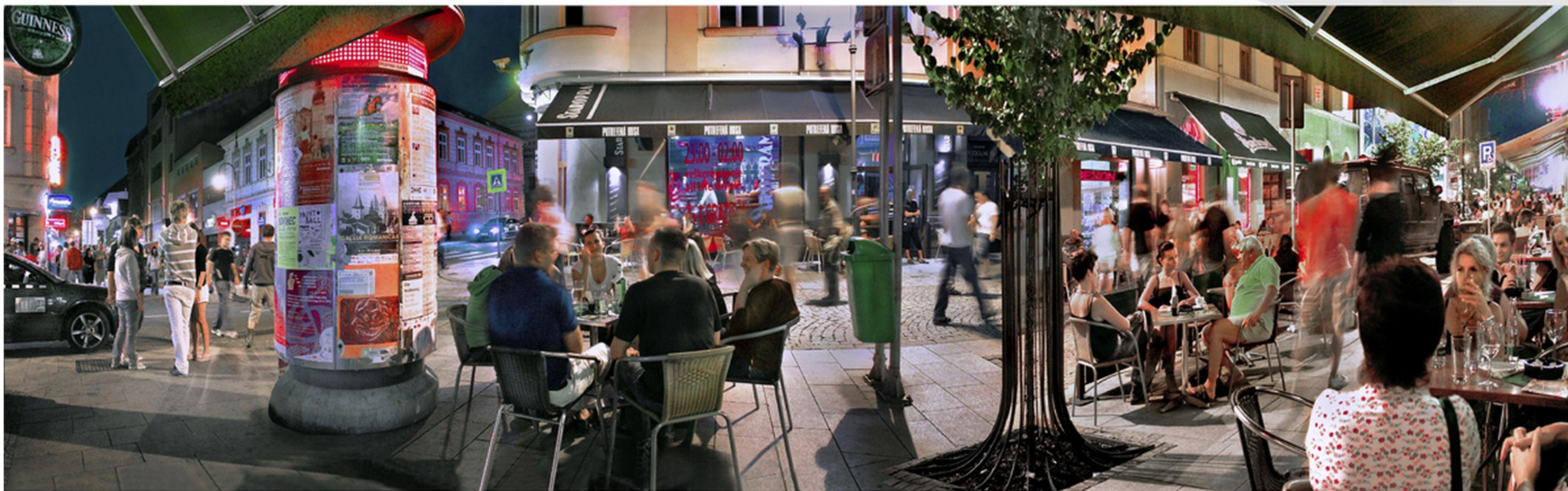
prázdninový víkend - Stodolní ulice, 22 hodin