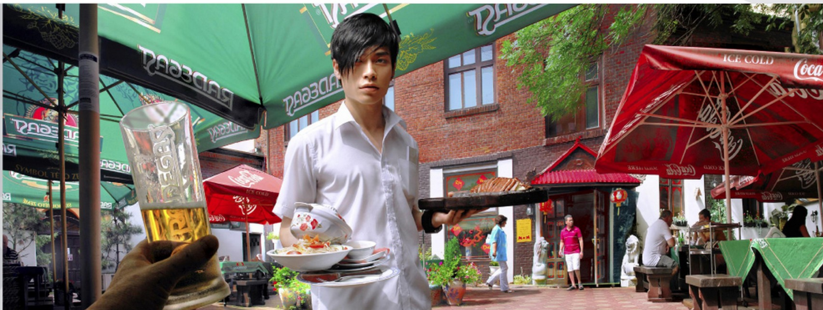
asijská restaurace v centru města