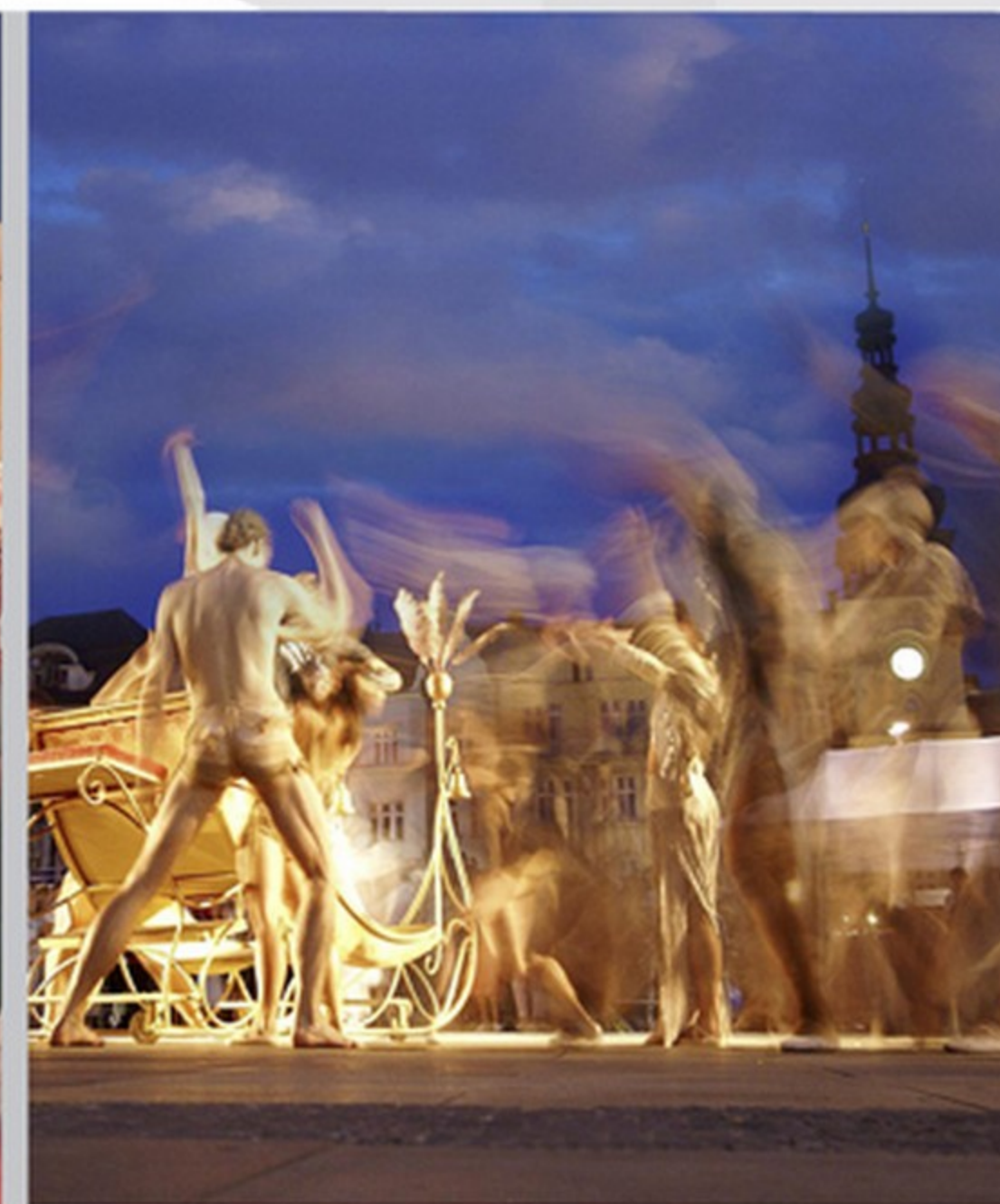
také městské muzeum prošlo náročnou generální rekonstrukcí