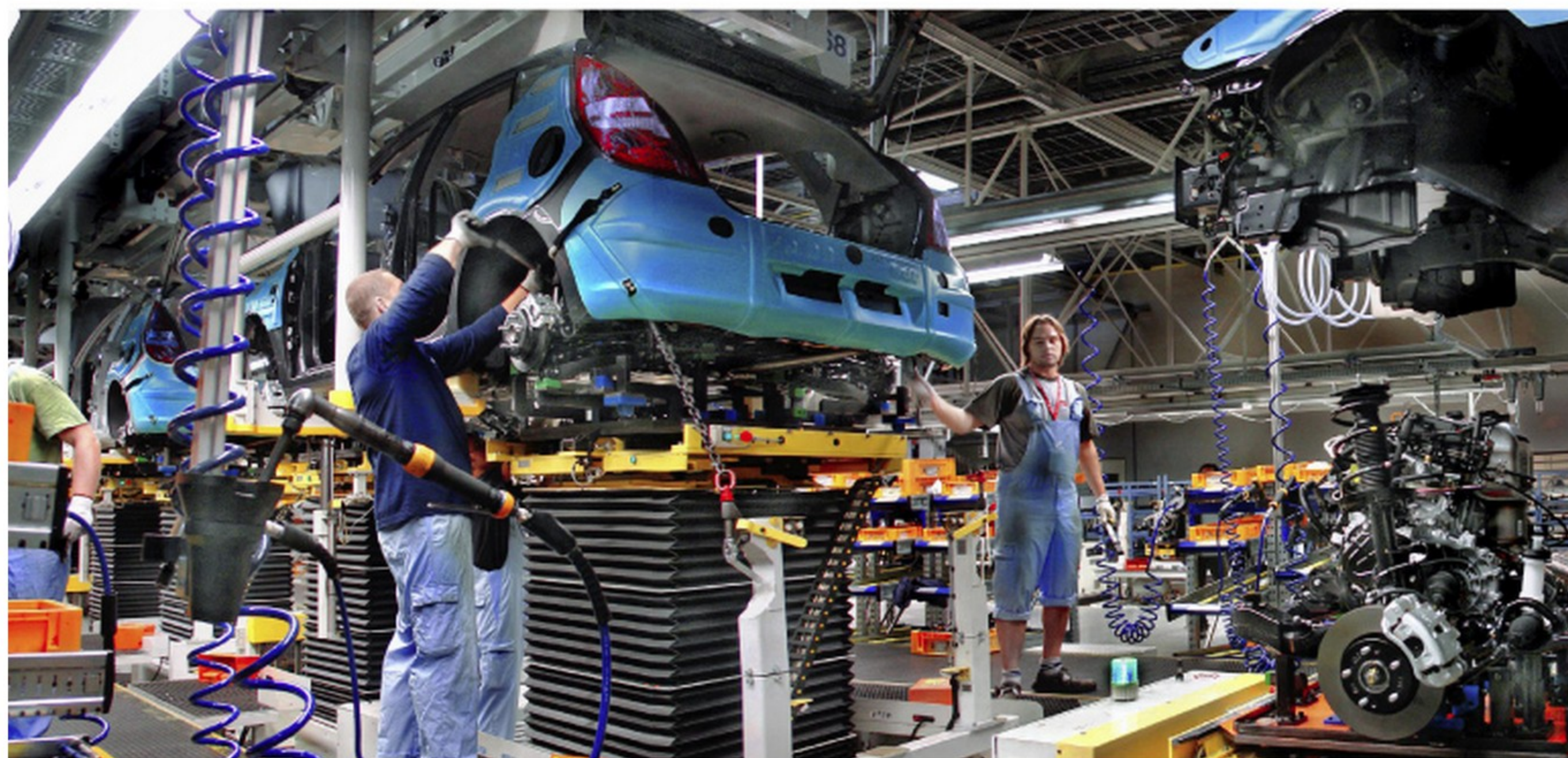
automobilka Hyundai zaměstnala téměř 2000 lidí a ovlivnila rozvoj celého regionu