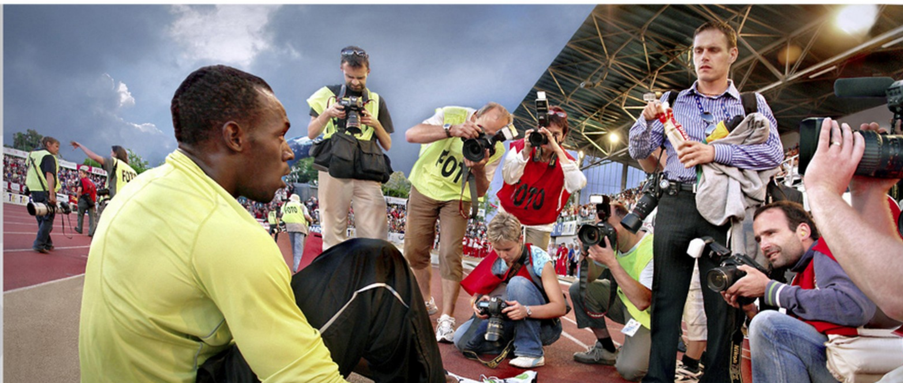
nejrychlejší muž planety Usain Bolt na mítinku "Zlatá tretra"