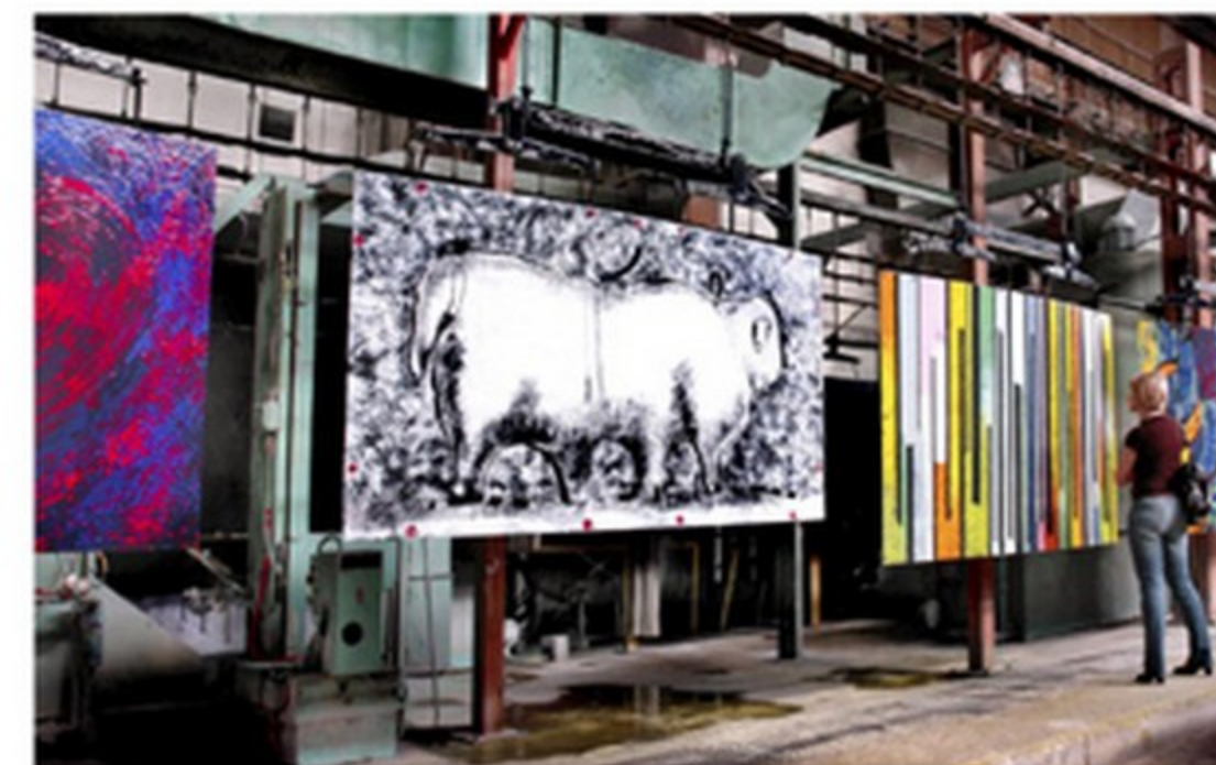
symposium smaltu AVE ART ve Vítkovicích a.s.

město zažívá nebývalý rozvoj kulturních i uměleckých aktivit, vznikají zajímavé projekty, mezinárodní divadelní, hudební i výtvarné workshopy a festivaly