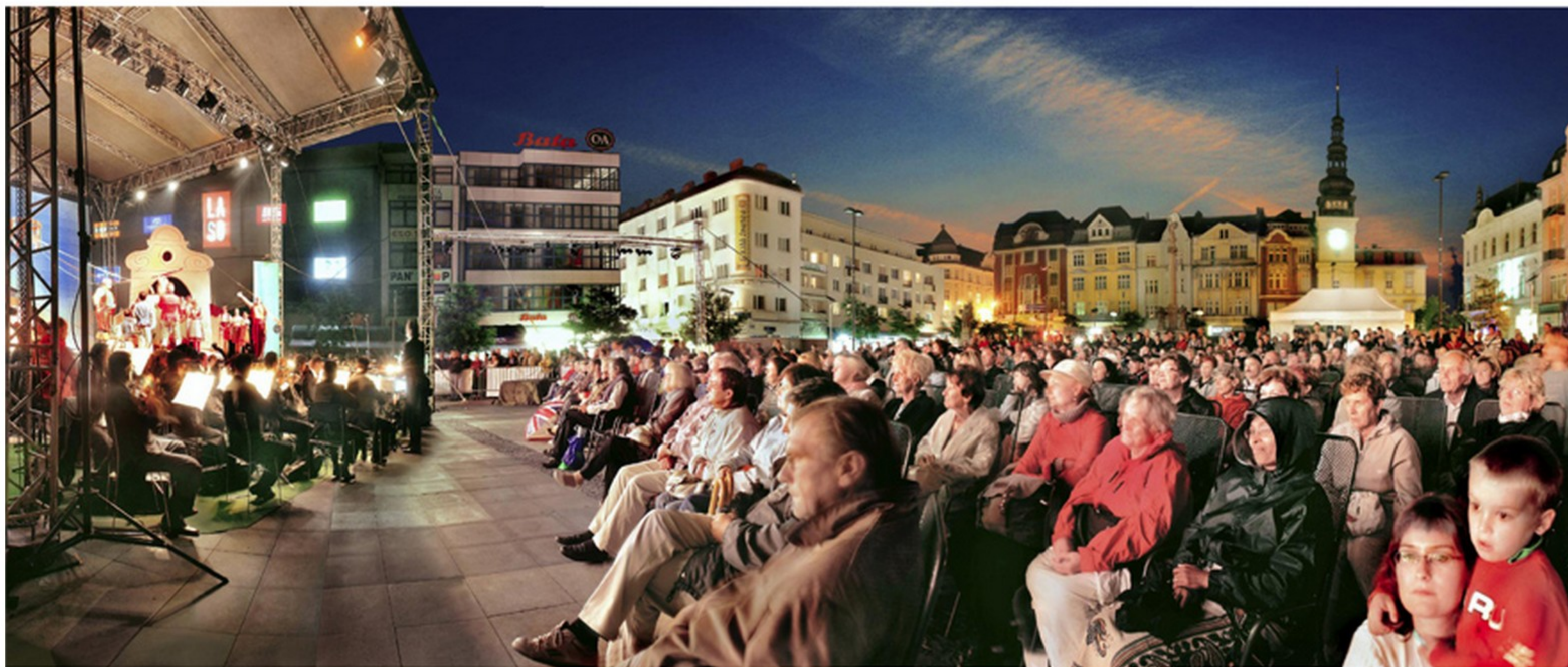
představení Prodané nevěsty na oslavách 90 let od založení Národního divadla moravskoslezského