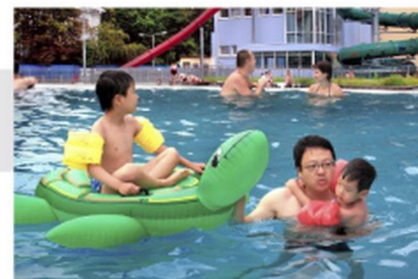
městské koupaliště "Čapkárna" v novém

začínáme si zvykat na multinárodnostní a multikulturní společnost, učíme se v ní hledat a nacházet nové podněty, inspiraci a povzbuzení