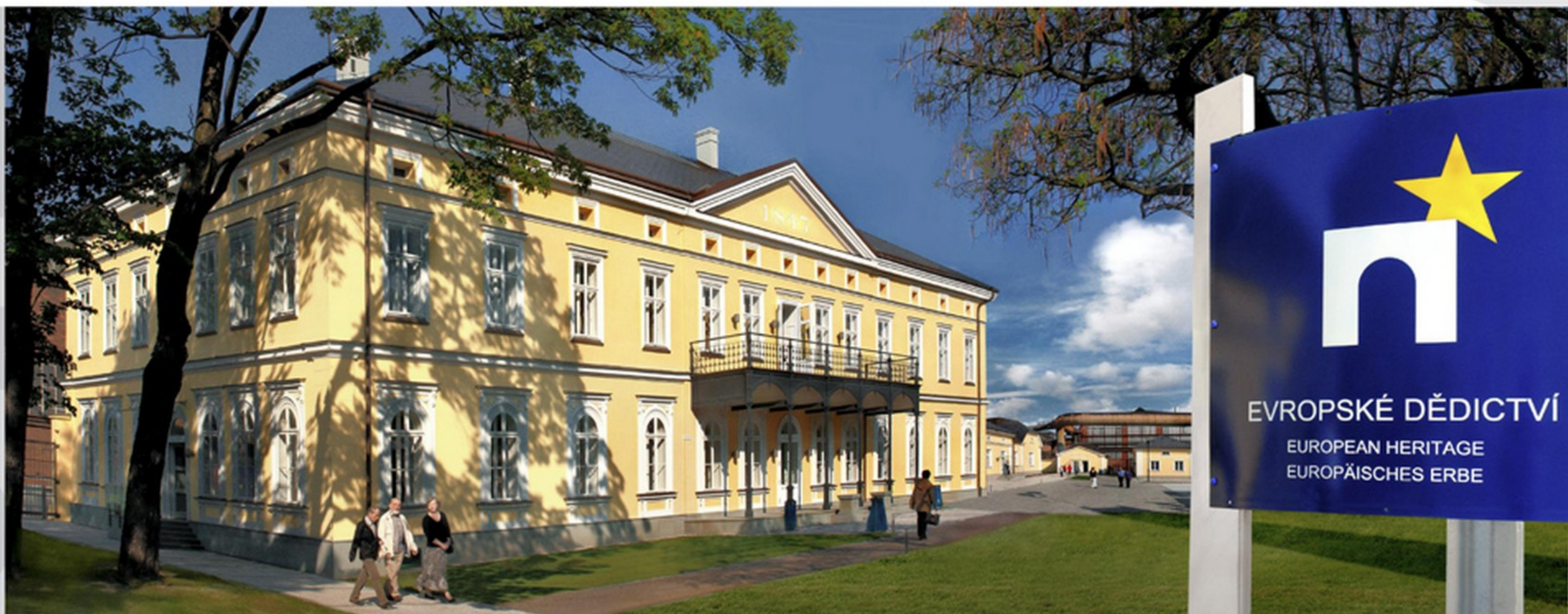
Vítkovice Machinery Group financovaly v roce 2008 obnovu Rothschildova zámku