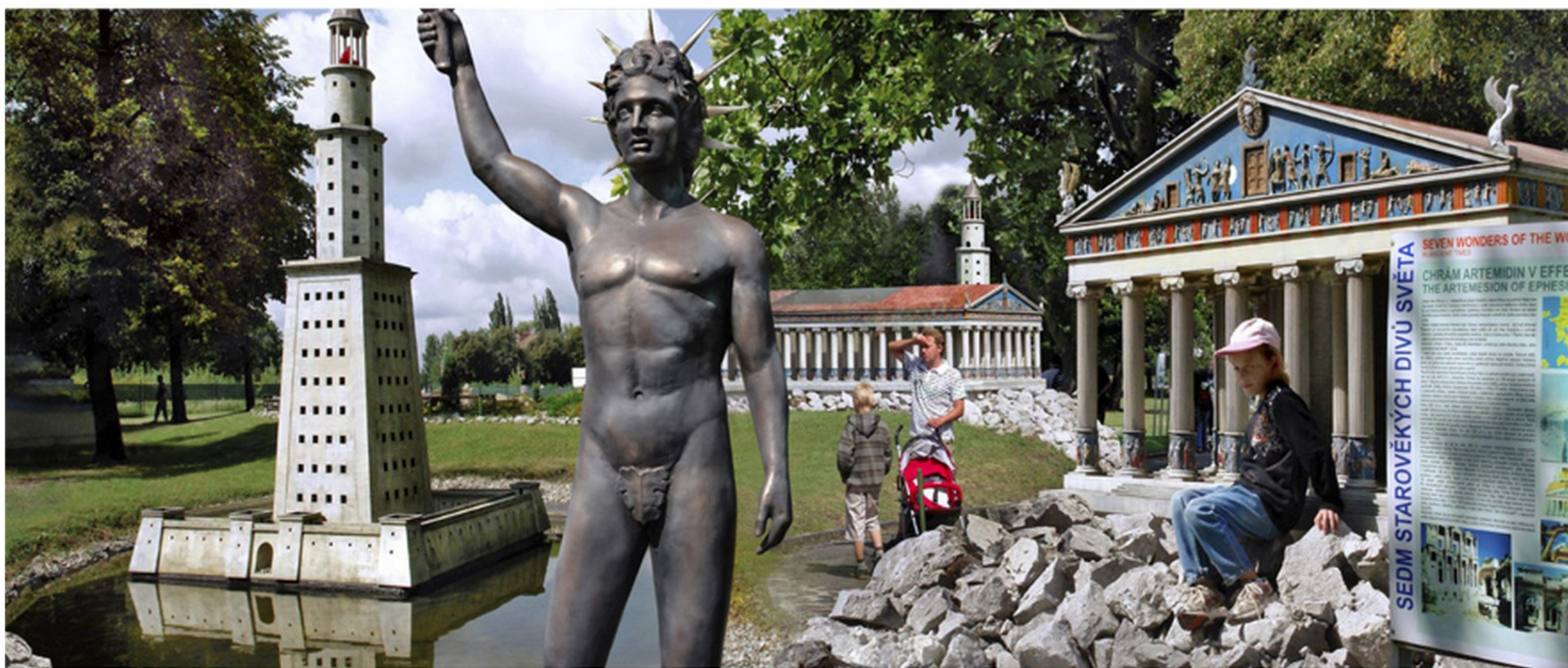
městečko miniatur Miniuni na Černé louce

jednou z mnoha nových možností, které přinášejí poznání i zábavu současně, je unikátní městečko Miniuni vyhledávané příjíždějícími návštěvníky města