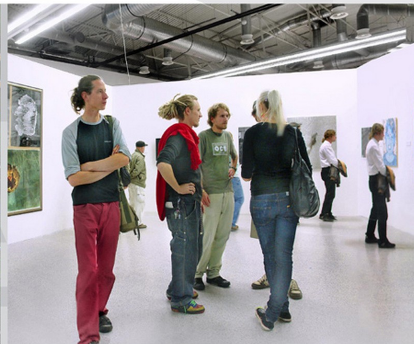
Ostrava kandiduje na Evropské hlavní město kultury 2015