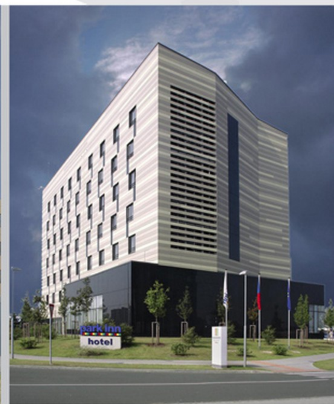
první hotel mezinárodního řetězce Park Inn v České republice - Stavba roku 2008